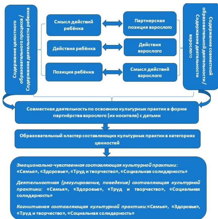
Рис. 1. Структурная модель содержания образовательной деятельности

Содержание деятельности взрослого по созданию условий в процессе приобретения детьми ценностей включает описание основных действий взрослого по формированию ценностных ориентиров детей как социально-обусловленного отношения их к окружающему миру, понимание, осознание и принятие ими социально значимых ценностей, сформированных в группы ценностных ориентиров: «Семья», «Здоровье», «Труд и творчество», «Социальная солидарность», которые приобретают для него личный смысл и выступают регулятором поведения (рис. 2).