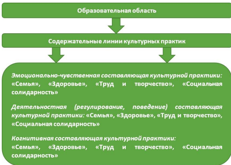
Рис. 2. Модель реализации содержания образовательной области

Функции взрослого в процессе приобретения детьми ценностей: